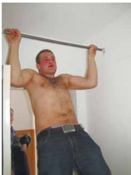
Дівчата люблять Сильних...