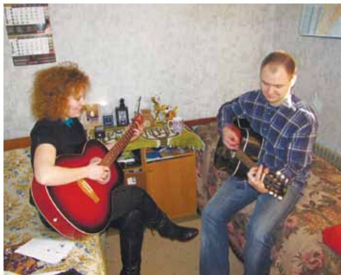
Дві гітари - гарна пара... І пісня на два голоси...