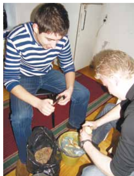
Мудрих і... працюючих!