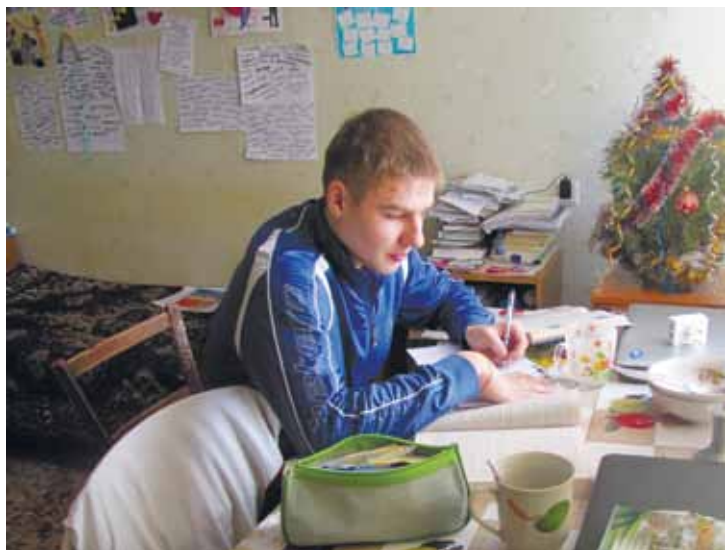
“Бомби” написав... Ще напишу кілька шпаргалок...