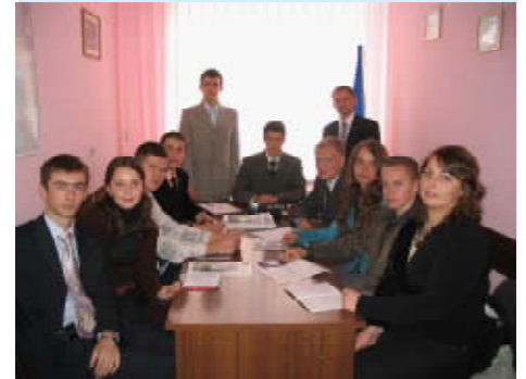
На фото — засідають-радіться члени студентського наукового товариства